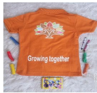
Filles et garçons